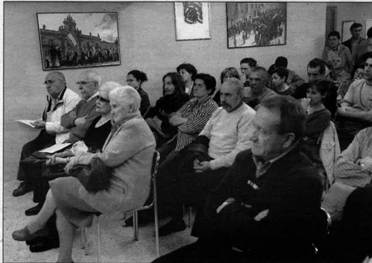
Asistentes a la presentación, ayer, del libro 'Memoria viva' en la sede del Ateneo Republicano.