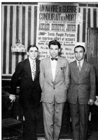
Ascaso, Durruti y Jover.

las huellas de una de las figuras más importantes del anarcosindicalismo y a la vez de las más desconocidas. A la espera de confirmar editorial para ver publicado su trabajo, los autores nos desvelan pasajes de la vida de uno de los hombres más duros, quizá el más, de CNT, Francisco Ascaso Abadía.