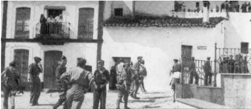
Las tropas de Redondo a su llegada a Galaroza.

Campeñinos y canteros guardaron el secreto y ayudaron a superar el largo 'entierro' a los seis de la Cueva de Alcalá