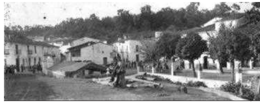
Navahermosa en 1936. MARIO RODRÍGUEZ