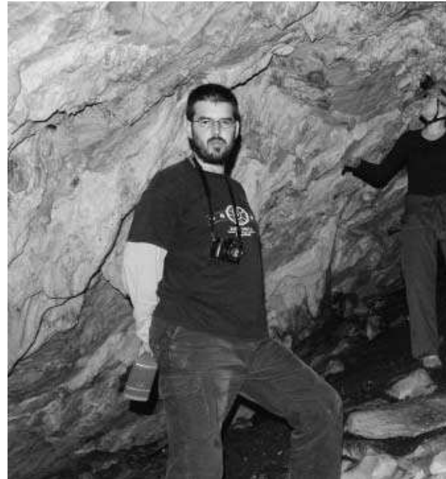
La cueva tiene una gran sala y varias galerías que recorren el interior de la cantera de Fuen