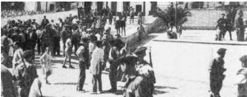
Galaroza en el verano del 36.

FOTO DEL LIBRO: LA GUERRA CIVIL EN HUELVA/EMILIO BENEYTO