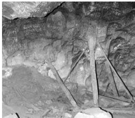
Camastro que aun se puede ver en la Cueva de Alcalá. MARIO RODRÍGUEZ